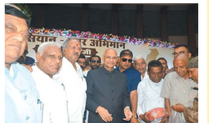
छत्तीसगढ़ के माटीपुत्र, महाराष्ट्र के राज्यपाल रमेश बैस के जन्मदिन के अवसर पर आयोजित कार्यक्रम में भाजपा प्रदेश प्रभारी ओमप्रकाश माथुर, प्रदेश अध्यक्ष अरुण साव, नेता प्रतिपक्ष श्री नारायण चंदेल एवं विधायक बृजमोहन अग्रवाल एवं अन्य ने मुलाकात की।