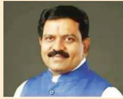
विजय शर्मा, उप मुख्यमंत्री गृह, जेल, पंचायत, ग्रामीण, विकास, तकनीकी शिक्षा एवं रोजगार, विज्ञान और प्रौद्योगिकी