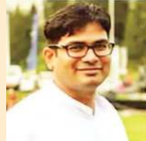
ओपी चौधरी वित्त, वाणिज्य कर आवास एवं पर्यावरण, योजना, आर्थिक एवं साक्षिकी