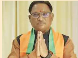
विष्णुदेव साय, मुख्यमंत्री सामान्य, खनिज संसाधन, ऊर्जा, जनसंपर्क वाणिज्य कर (आबकारी), परिवहन, अन्य विभाग जो किसी मंत्री के पास न हो।

रायपुर। छत्तीसगढ़ में मंत्रियों के विभाग तय हो गए हैं। डिप्टी सीएम अरुण साव को लोक निर्माण, विधि और नगरीय प्रशासन दिया गया है। वहीं विजय शर्मा गृह मंत्री बनाए गए हैं। इसके अलावा उन्हें तकनीकी शिक्षा और रोजगार की भी जिम्मेदारी दी गई है। वहीं IAS की नौकरी छोड़कर विधायक और मंत्री बने ओपी चौधरी अब वित्त विभाग संभालेंगे। मुख्यमंत्री विष्णुदेव साय ने विभागों के बंटवारे के बाद सभी मंत्रियों को बधाई दी है। उन्होंने कहा है कि विभागों का बंटवारा कर दिया गया है। सभी मंत्री अपने-अपने विभागों से अब जनता के हित के लिए कार्य करेंगे।