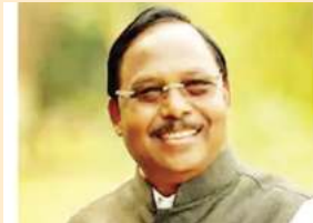
राम विहार नेताम आदिम जाति विकास, अनुसूचित जाति विकास, पिछड़ा वर्ग एवं अल्पसंख्यक विकास, कृषि विकास एवं कृषि कल्याण