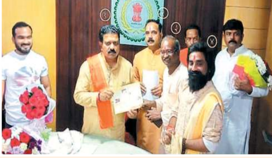
रहे हैं यह मंदिरोंकी कृषि उपज सरकार द्वारा पुनः खरीदी जाए इस मांग को लेकर

रायपुर - पूर्व में जब छत्तीसगढ़ राज्य में भाजपा की सरकार थी, तब शासन द्वारा छत्तीसगढ़ के समस्त मंदिरों की कृषि भूमि से उत्पादित धान को शासन द्वारा खरीदा जाता था। साथ ही पूर्ण बोनस भी प्रदान किया जाता था। जिससे राज्य मठ-मंदिरों की कृषि उपज से सहजता से उत्पन्न मिलता था। साथ ही आपत्कालीन स्थिति में शासन द्वारा सहायता भी मिलती थी परन्तु पिछली कांग्रेस की सरकार में मंदिरों की कृषि उपज की खरीदारी एवं बोनस का वितरण बंद कर दिया गया था। जिस कारण कई मंदिर आर्थिक संकट से जूझ