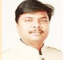
केदार कश्यप वन एवं जलवायु परिवर्तन, जल संसाधन, कौशल विकास एवं सहकारिता