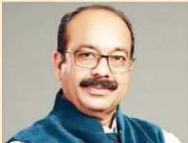
अरुण साव, उप मुख्यमंत्री लोक निर्माण, लोक स्वास्थ्य यांत्रिकी, विधि और विधायी कार्य, नगरीय प्रशासन