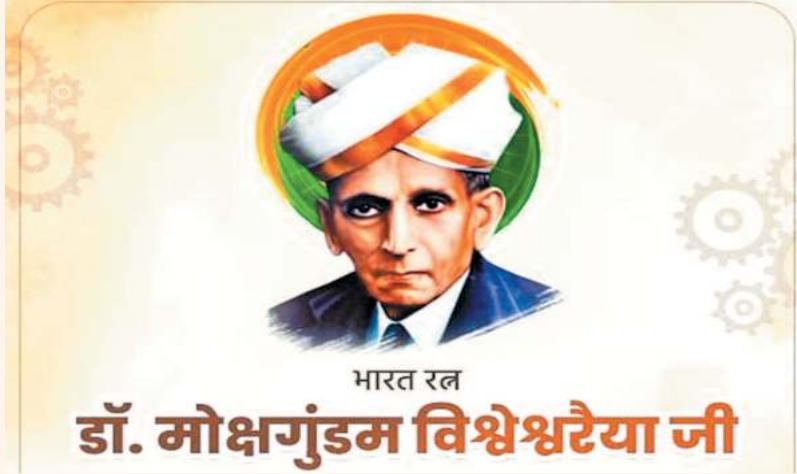
भारत रत्न डॉ. मोक्षगुंडम विश्वेश्वरैया जी

भारत में हर साल 15 सितंबर को इंजीनियर दिवस का आयोजन किया जाता है। यह दिन भारत के उन सभी इंजीनियरों को समर्पित है, जो विकसित भारत के सपने को साकार करने में अपने कौशल से इस सपने को आकार दे रहे हैं। हालांकि, क्या आप जानते हैं कि भारत में इंजीनियर दिवस किसकी याद में मनाया जाता है। यदि नहीं, तो इस लेख के माध्यम से हम इस बारे में जानेंगे। भारत में इंजीनियरों की कमी नहीं है। सिविल, मैकेनिकल, इलेक्ट्रिकल, सॉफ्टवेयर व ऑटो इंजीनियरिंग से लेकर विभिन्न वर्गों में हमें इंजीनियर देखने को मिल जाते हैं। देश में हर साल 15 सितंबर को इंजीनियर दिवस का आयोजन किया जाता है। यह दिन भारत के उन सभी इंजीनियरों को समर्पित है, जो विकसित भारत के सपने को साकार