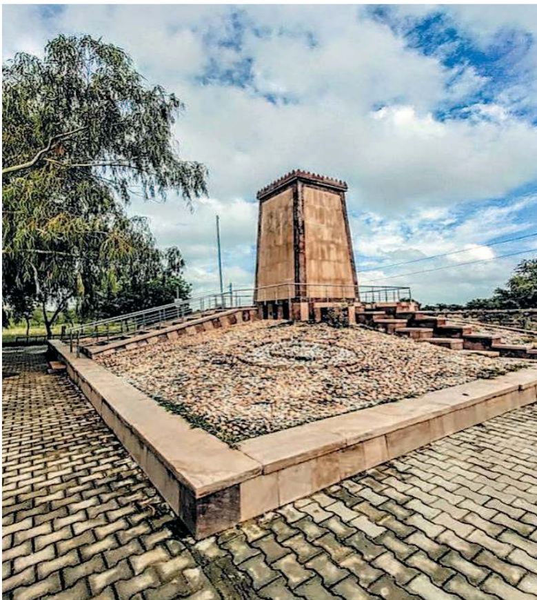
खेजड़ली, जोधपुर, राजस्थान, भारत के पास हरे पेड़ों को बचाने के लिए शहीद 363 बिश्नोंईयों की स्मृति में एक स्मारक